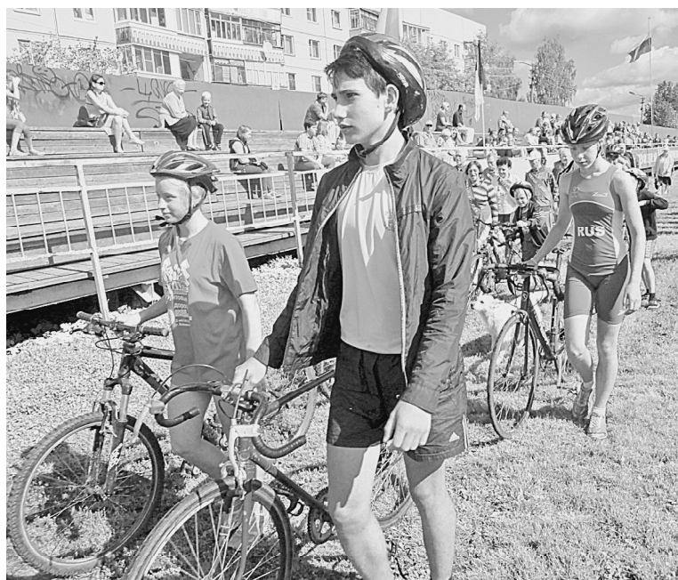
На марше – триатлонисты

На следующий день прошли массовые соревнования на стадионе «Волна» и турниры по пляжному волейболу на «Металлурге» и на площадке возле автодорожного колледжа.