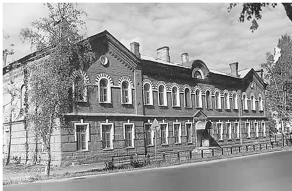
Начальная школа № 3 на улице Гоголя