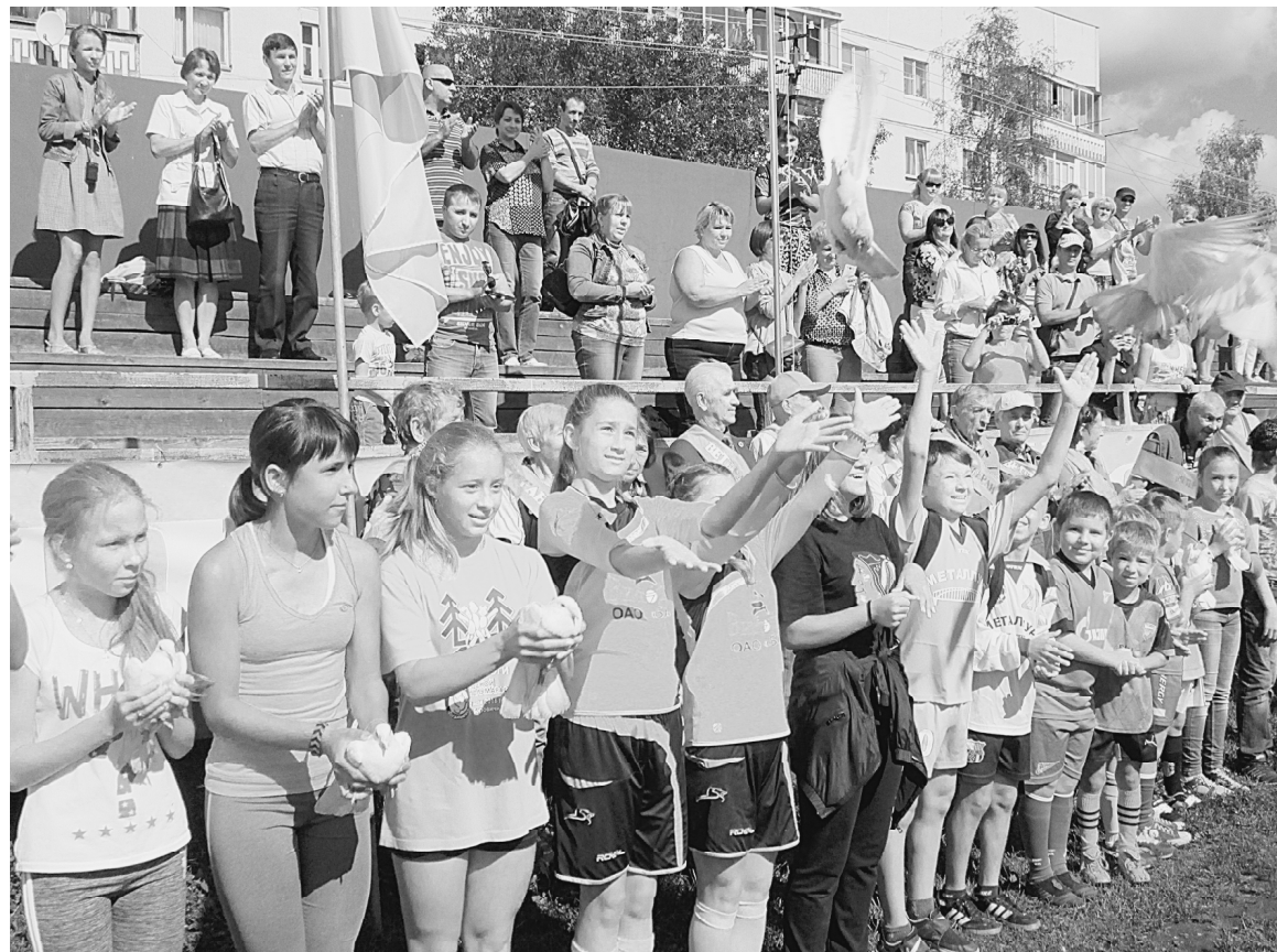
Дети выпускают стаю голубей