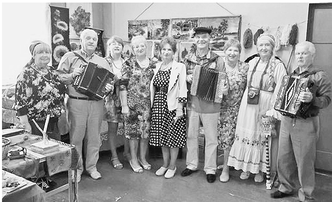
В Плавкове главным персонажем была гармонь

сладкое — русские витушки и медовый татарский чак-чак.