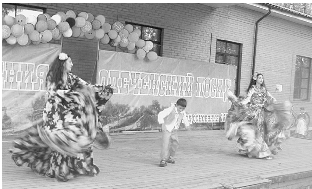
В Опеченском Посаде прошёл первый Боровичский фестиваль национальных культур