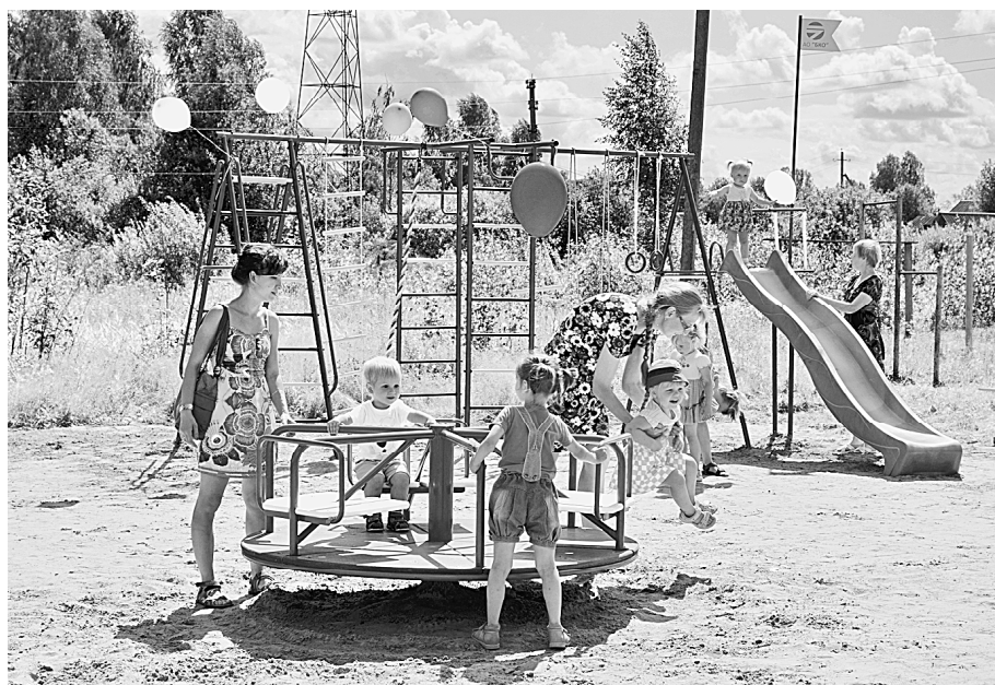
Большим сюрпризом для жителей деревни Волок стало открытие детской игровой площадки