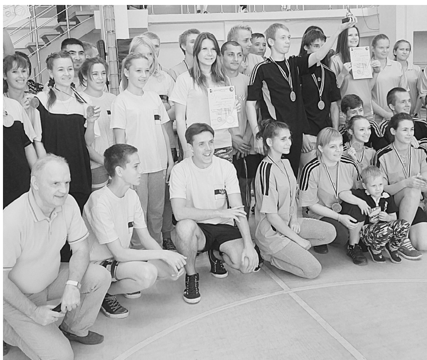
Участники сельской спартакиады с призами и дипломами